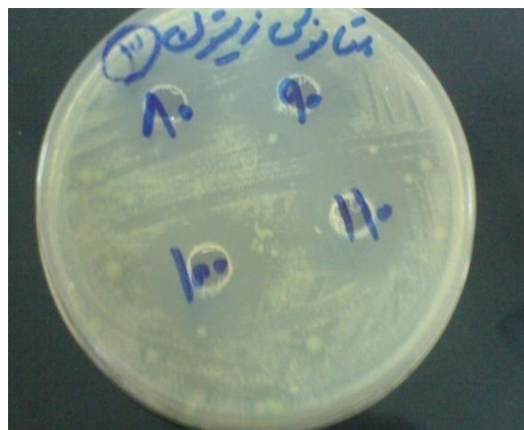
شکل ۲. نتایج قطر هاله ممانعت از رشد در اطراف چاهک حاوی ۸۰، ۹۰، ۱۰۰ و ۱۱۰ میلی گرم در میلی لیتر از عصاره متانولی میوه زیتون تلخ به روش چاهک

میانگین قطر هاله ممانعت از رشد در اطراف چاهک حاوی ۸۰، ۹۰، ۱۰۰ و ۱۱۰ میلی گرم در میلی لیتر از عصاره متانولی به ترتیب 24/66 \pm 0/57 ، 26/33 \pm 0/57 و 29/33 \pm 2/3 میلی متر بود (شکل ۲).