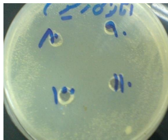
شکل ۳. نتایج قطر هاله ممانعت از رشد در اطراف چاهک حاوی ۸۰، ۹۰، ۱۰۰ و ۱۱۰ میلی گرم در میلی لیتر از عصاره اتانولی میوه زیتون تلخ به روش چاهک

میانگین قطر هاله عدم رشد برای غلظت های ۸۰، ۹۰، ۱۰۰ و ۱۱۰ میلی گرم در میلی لیتر از عصاره اتانولی به ترتیب 29/66 \pm 2/08 ، 34 \pm 2/64 ، 37 \pm 1 و 40 \pm 1 میلی متر بود (شکل ۳).